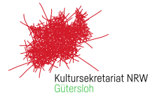
Logo frei auf weißer Fläche

Dieser Schutzraum ist schon in den jeweiligen Datei-Varianten angelegt.