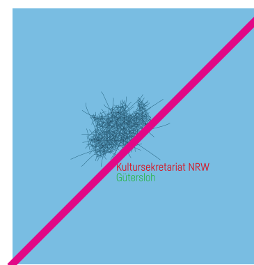
Es sind keine Änderungen der Farben innerhalb des Logos erlaubt!