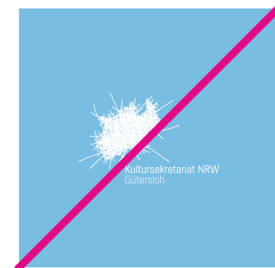
Es gibt auch keine negative Logo-Variante, auch nicht nur Schrift oder Logoelement!