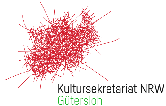
Logo Variante A – hoch